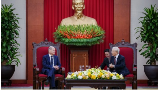
Olaf Scholz in Hanoi, 13.11.2022