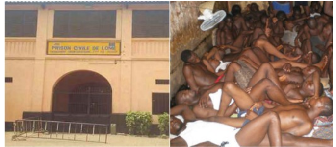
Eine Schande für Faure Gnassingbé!

Um mehr Platz zum Ausruhen zu gewinnen, lassen die wachhabenden Polizisten die Prioniere wie Sardinen in eine Büchse stecken.