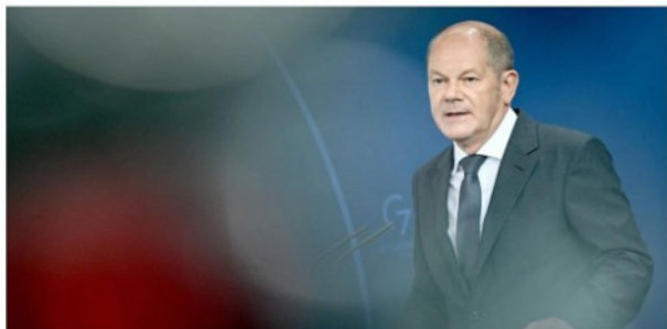
Bundeskanzler Olaf Scholz (SPD)