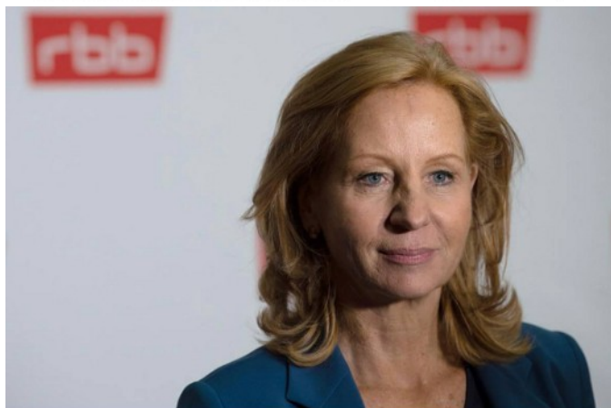
Als ARD-Vorsitzende und RBB-Intendantin zurückgetreten: Patricia Schlesinger