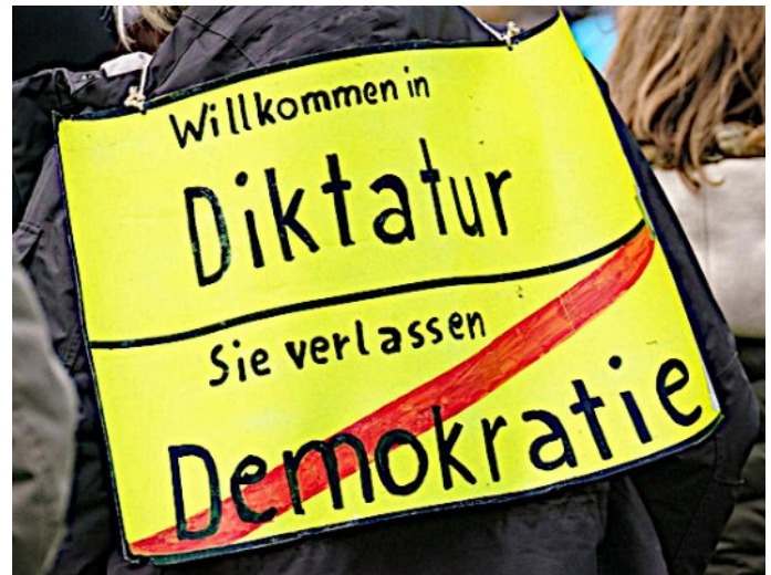
Bildausschnitt aus dem Webseitenbild des Deutschlandfunk

Im Zuge des anschwellenden Protestes, der sich natürlich proportional zu den Tyranneien der Regierungen (Bundesregierung und Landesregierungen) entwickelt, tritt eine Behörde immer mehr ins Licht der Öffentlichkeit, die eigentlich im Geheimen, weil außerhalb des Legalen, aber natürlich mit großzügigen Genehmigungen, operiert. Der Inlandgeheimdienst BfV (Bundesamt für Verfassungsschutz) und die Landesämter, als Teil der Exekutive der Regierungen. Diese Behörde hat die Aufgabe, die Regierungen zu schützen und ggf. auch wenn es nötig ist und das Grundgesetz dem im Wege stehen sollte, entgegen dem Grundgesetz. Insofern ist schon der Name eine Lüge und wer lügt, möchte die Wahrheit natürlich gewaltsam verhindern. Aber Staatsgewalt braucht Legitimation. Der Chef der Potsdamer Behörde, Müller, sagt: „Der Verfassungsschutz beobachte mit wachsamen Augen entsprechende staatsfeindliche Bestrebungen“ heißt: Der Verfassungsschutz bespitzelt und spioniert also schon mal vorbeugend durch Massenüberwachung Inanspruchnahmen von Grundrechten, wie z.B. Artikel 8 GG und wertet dies per se schon mal als staatsfeindlich. Natürlich rein zur Vorbeugung, weil: der Schäfer meint es doch gut mit seinen Schafen. Was sagte noch ein gewisser Herr Mielke: „Ich liebe euch doch alle!“ Interessant, was für ein Bild der Redakteur der Webseite des Deutschlandfunk verwendet.